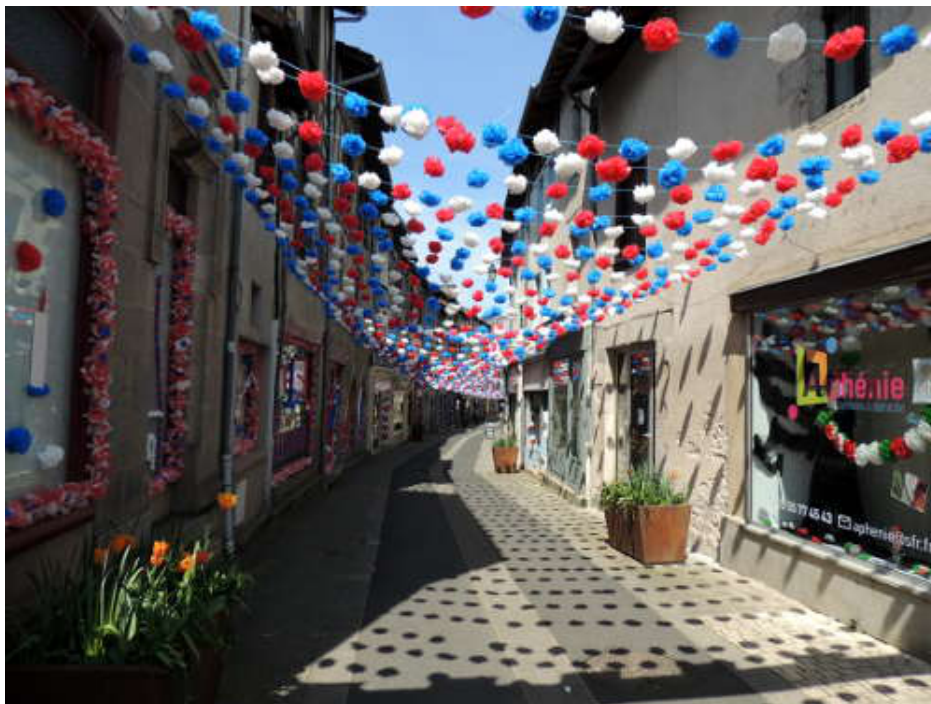
Une rue de Saint-Léonard-de-Noblat.

Il est 10h30, quand nous enfourchons nos vélos et commençons par une route grimpante et bien raide par endroits. Après Saint-Julien-le-Petit, nous quittons notre circuit et prenons à gauche pour rejoindre directement Saint-Léonard-de-Noblat où nous souhaitons faire un arrêt prolongé. Le temps étant meilleur, je quitte mon gortex.