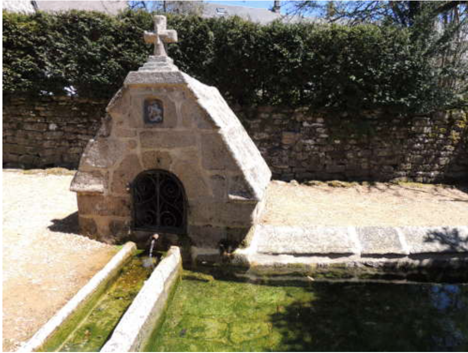
La Fontaine Saint-Georges.

Après Bugeat, nous pique-niquons en sous bois. C'est à Tarnac que nous faisons une halte pour nous désaltérer à la fontaine Saint-Georges. Elle date du XVIIe siècle, entièrement réalisée en granit et dominée par une croix. Cette fontaine remplace celle réalisée au 11e et 12e siècle. Autrefois, l'eau de cette source était considérée aussi pure et sainte que l'eau bénite. Elle était d'abord utilisée pour l'eau des baptêmes, seule source potable publique jusqu'en 1890. Jusqu'au XXe siècle, elle servait également de lavoir et permettait de faire boire les troupeaux.