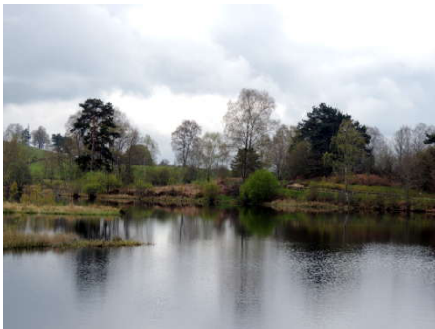
En quittant l'île...

A deux pas du château, une petite pause s'impose, pour profiter de la vue, faire quelques photos, jeter un petit coup d'œil au Centre d'Art Contemporain, avant de reprendre le pont et retrouver notre circuit.