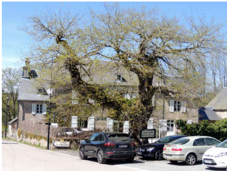
Chêne dit "de Sully".

Après Bugeat, nous pique-niquons en sous bois. C'est à Tarnac que nous faisons une halte pour nous désaltérer à la fontaine Saint-Georges. Elle date du XVIIe siècle, entièrement réalisée en granit et dominée par une croix. Cette fontaine remplace celle réalisée au 11e et 12e siècle. Autrefois, l'eau de cette source était considérée aussi pure et sainte que l'eau bénite. Elle était d'abord utilisée pour l'eau des baptêmes, seule source potable publique jusqu'en 1890. Jusqu'au XXe siècle, elle servait également de lavoir et permettait de faire boire les troupeaux.