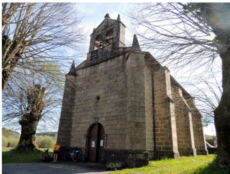
Eglise de Compeix.

Il fait bien beau ce matin. Notre circuit va nous conduire à Bourganeuf. A 9h30, c'est le départ après avoir acheté notre traditionnel pique-nique au village. Cool, celà descend et nous arrivons rapidement à Compeix où nous nous arrêtons à l'église.