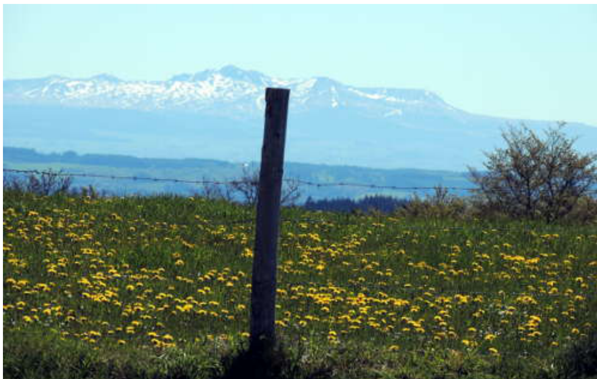
Au fond, le Puy de Sancy enneigé.

quelques pas de la ligne de partage des eaux des bassins de la Loire et de la Dordogne. Devant nous, au loin, le panorama nous offre le Puy de Sancy enneigé.