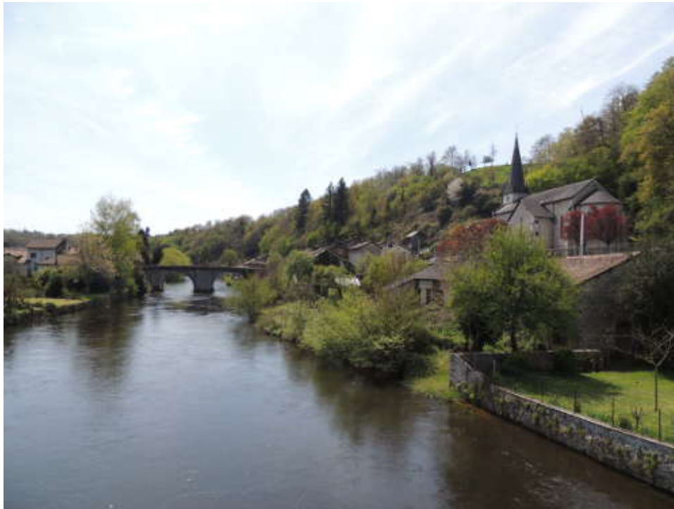
Le Pont de Noblat sur la Vienne.

Repartis, nous passons le pont de Noblat qui enjambe la Vienne en cherchant un coin repas. Les forces reprises, nous grimpons 3 km par erreur, et c'est avec plaisir que nous les descendons et rattrapons la D29 qui longe la Vienne.