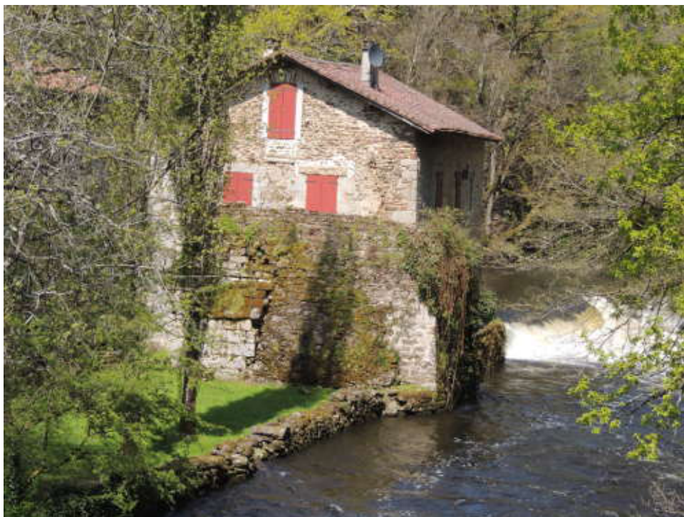
Le Moulin de l'Artigues.

Repartis, nous passons le pont de Noblat qui enjambe la Vienne en cherchant un coin repas. Les forces reprises, nous grimpons 3 km par erreur, et c'est avec plaisir que nous les descendons et rattrapons la D29 qui longe la Vienne.