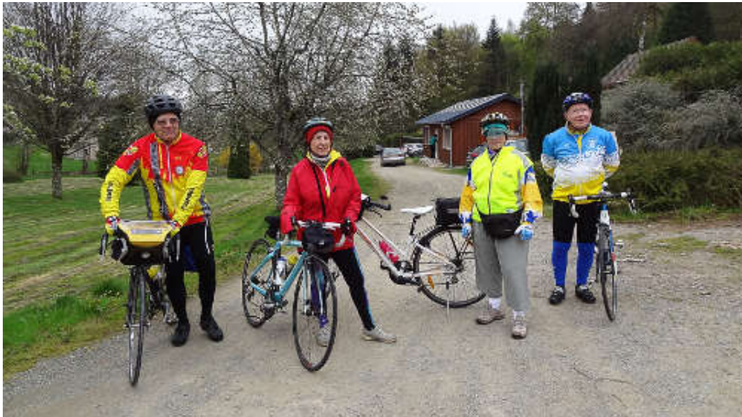
La fine équipe...