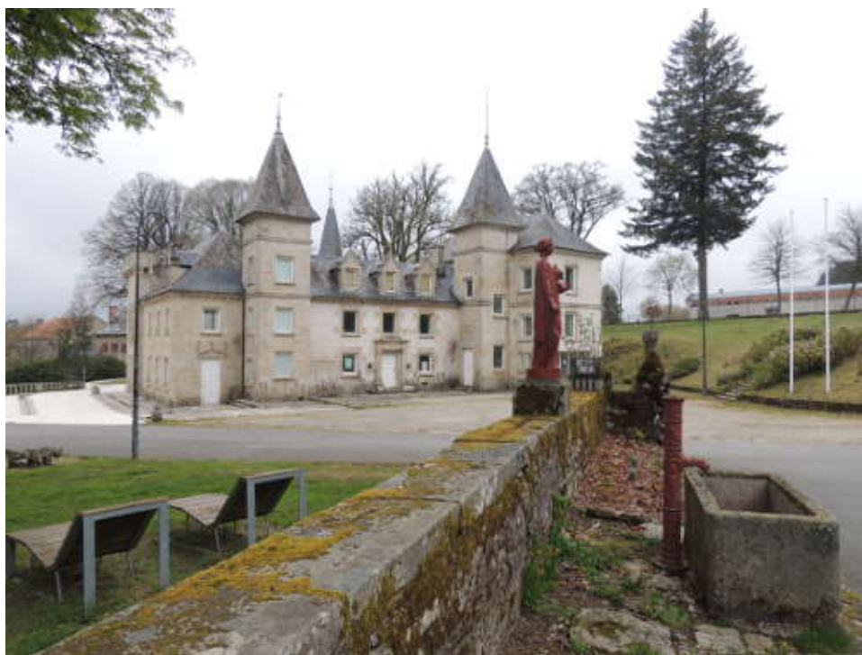
Le Château de l'île.

Après plusieurs montées et descentes, nous empruntons un pont pour rejoindre l'île de Vassivières, nous saluons les pêcheurs et grimpons une côte au fort pourcentage, mais pas de pied à terre!