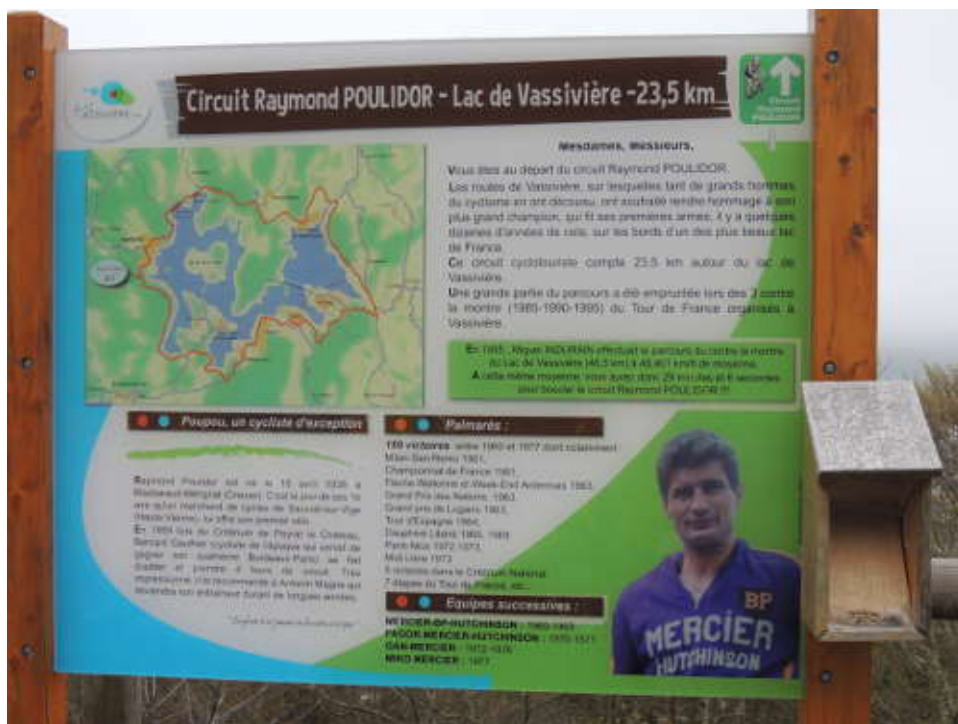
Circuit Raymond Poulidor.