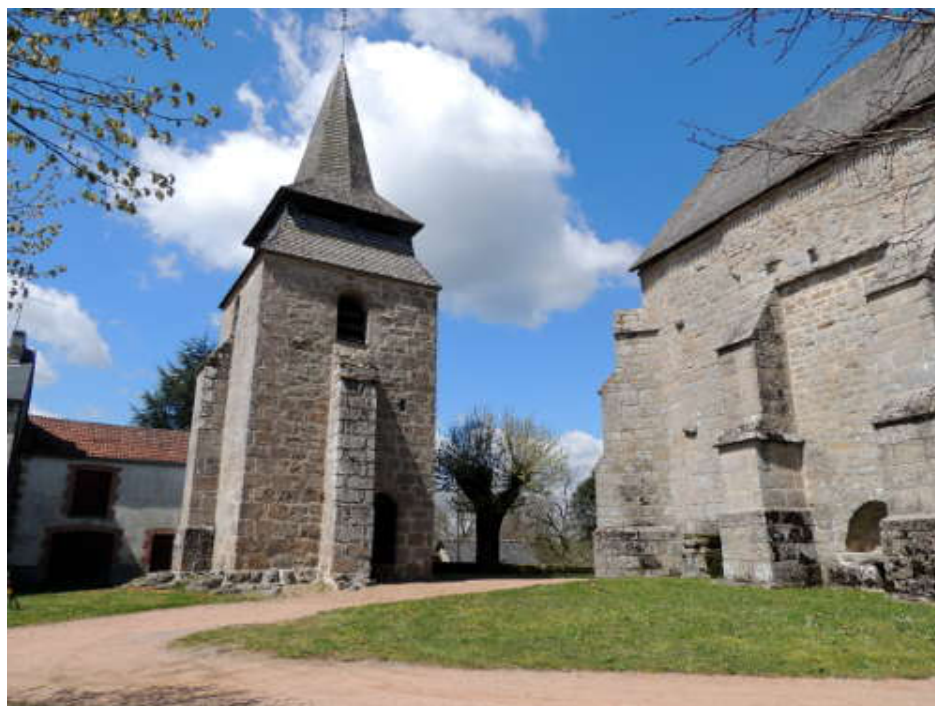
Eglise de La Nouaille.

Après Gentioux-Pigerolles, nous montons avant de descendre et de remonter sous un vent de plus en plus fort. En haut, la vue est magnifique, quelques photos, avant de poursuivre notre randonnée jusqu'à La Nouaille où nous décidons de reprendre des forces en pique-niquant sur les marches de l'église Saint-Pierre Saint-Paul, à l'abri du vent.