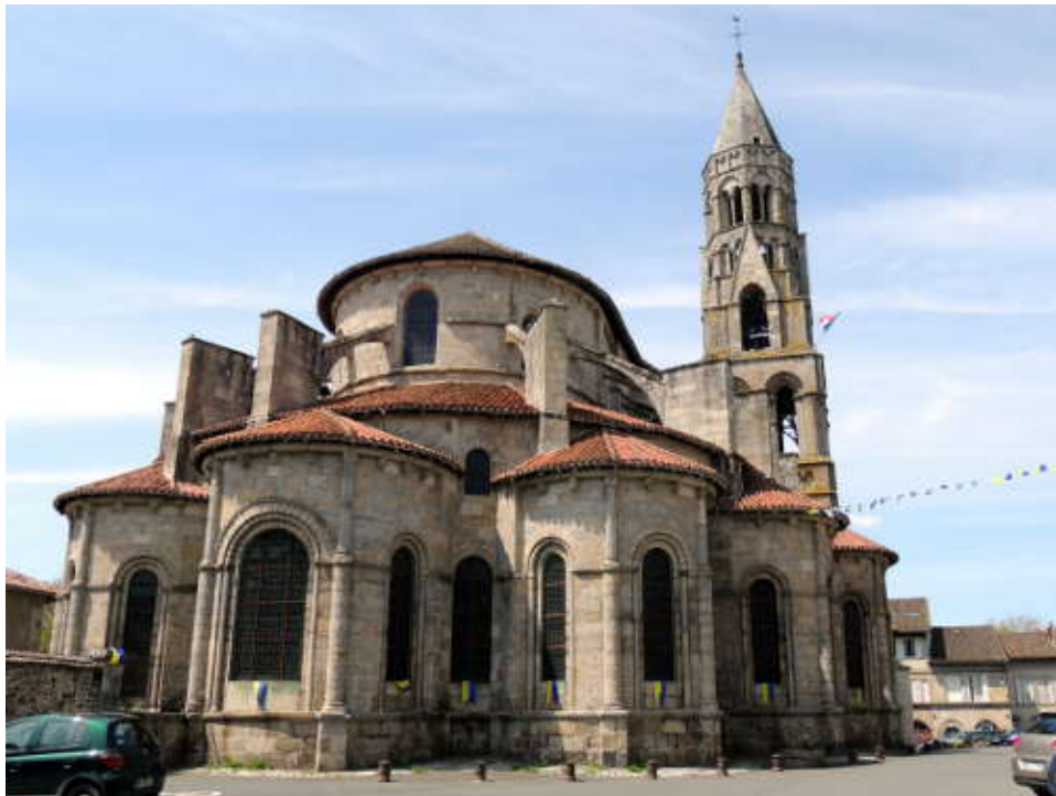
La Collégiale Saint-Léonard.

Les habitants accrochent des guirlandes aux couleurs de leur quartier. Nous sommes justement arrêtés dans le quartier orange et jaune, cela va très bien avec nos maillots et cette dame s'empresse de nous prendre en photo. Sur ses conseils, nous poursuivons par les petites rues et la visite de la Collégiale qui date des XIe et XIIe siècles avant de reprendre notre route.