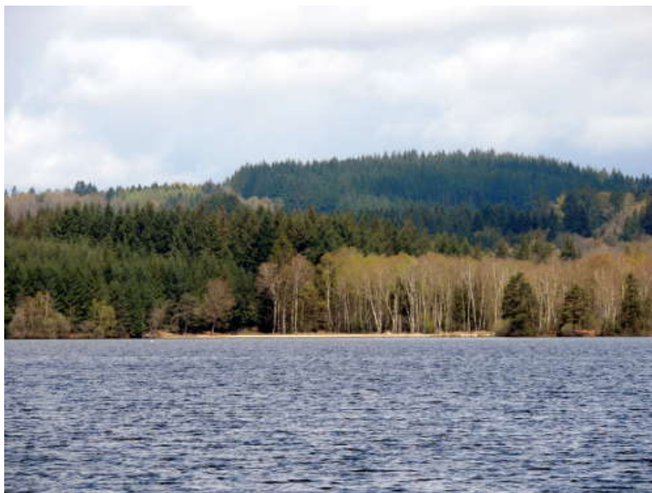
Le Lac de Vassivière.

Tout le monde est installé, et il est 20 heures, quand nous nous retrouvons dans la salle de restauration pour prendre l'apéritif de bienvenue offert par les propriétaires des lieux.