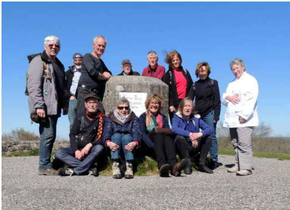
L'équipe en vadrouille... au Suc de May 908 m.

La semaine se termine avec 256 km parcourus et 3516 m de dénivelé positif.