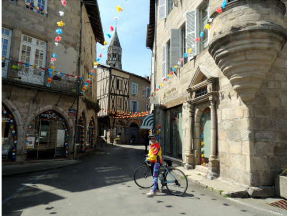
Ballade dans le Bourg.

Les habitants accrochent des guirlandes aux couleurs de leur quartier. Nous sommes justement arrêtés dans le quartier orange et jaune, cela va très bien avec nos maillots et cette dame s'empresse de nous prendre en photo. Sur ses conseils, nous poursuivons par les petites rues et la visite de la Collégiale qui date des XIe et XIIe siècles avant de reprendre notre route.