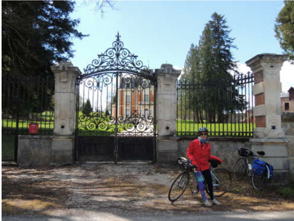
Une propriété aux environs de Saint-Yrieix-la-Montagne.

Nous poursuivons jusqu'à Saint-Yrieix-la-Montagne avant de s'arrêter au Lac de la Vaud-Gelade et son barrage, quelques photos et c'est le retour à Royères.