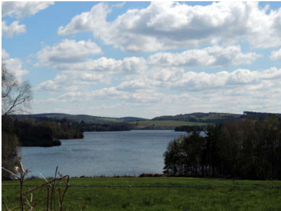
Lac de la Vaud-Gelade.

Nous poursuivons jusqu'à Saint-Yrieix-la-Montagne avant de s'arrêter au Lac de la Vaud-Gelade et son barrage, quelques photos et c'est le retour à Royères.