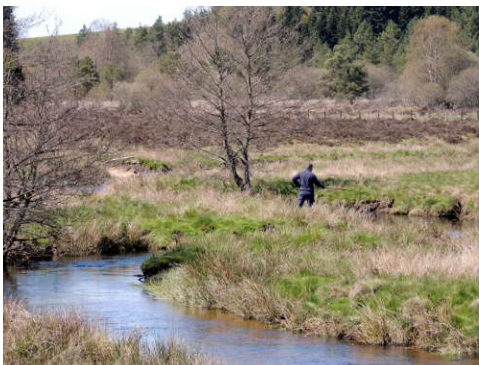
Le pêcheur d'ablettes.

quelques pas de la ligne de partage des eaux des bassins de la Loire et de la Dordogne. Devant nous, au loin, le panorama nous offre le Puy de Sancy enneigé.